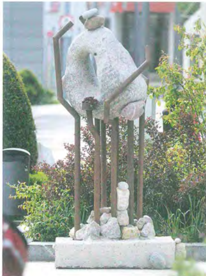
»Bredouille, Verhärtung«, William McCarthy, Granit und Stahl