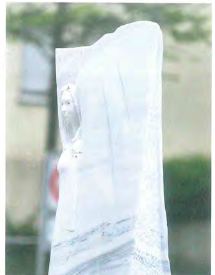
»Ein Engel in der Stadt«, Walter Wieland, LAASER MARMOR