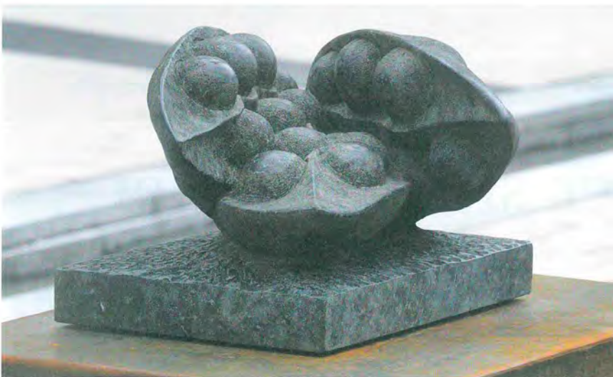
»Iris foetidissima«, Jochen Flogaus, HESSISCHER OLIVINDIABAS